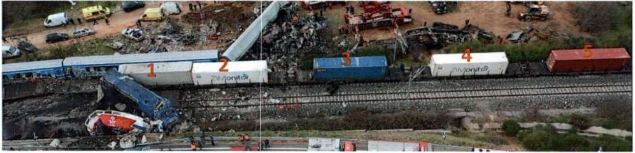
Φωτο 11. Τα 5 πρώτα container του εμπορικού συρμού